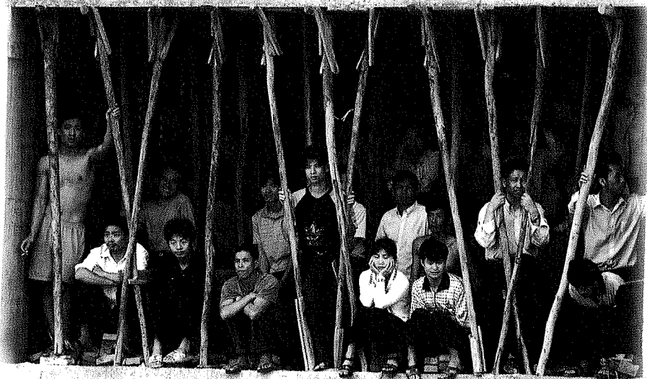
中國最有生產力的一代(約35-45歲)大都是文盲，與印度相比大異其趣。

是否不能勝出？試問誰說得來。然而眼前看到的形勢是：可勝不穩。你對中國的未來有了這個心理準備沒有？